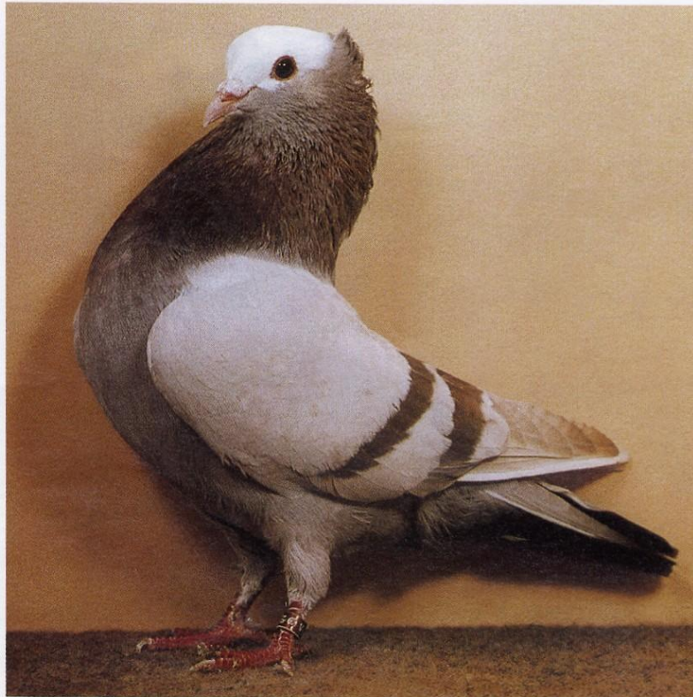
◁ 1,0 Mookeetauben, braunfahl, Deutsche Rassetaubenschau Stuttgart 1991 hv BLP (Gerd Körbl, Walheim).

Als wichtiges Rassemerkmal bei den Mookeetauben gilt die typische Körperform und Haltung mit gut gerundeter, vorgestreckter Brust und dem zurückgebogenen s-förmig getragenen Hals, der in Erregung eine elegante wippende Bewegung aufweist. Die Halsfeder ist straff und in einer