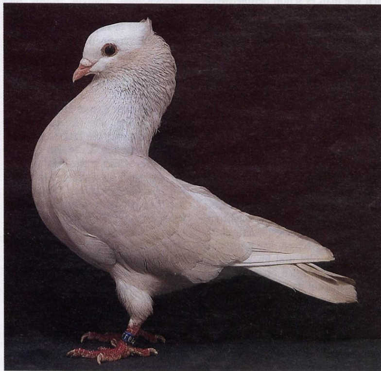
1,0 Mookeetauben, isabell, 77. Nationale Rassetaubenschau Nürnberg 1995 sg SZ (Michael Özler).

Bei sonst farbigem Gefieder sind nur die Kopfplatte und die äußeren Handschwinge weiß. Eine Ausnahme bildet der aufgehellte Rücken bei den blauen und fahlen Farbschlägen. Die Begrenzungslinie der Kopf-