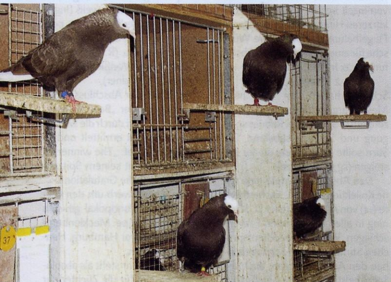
Braune Mookeetauben (Zuchttiere) in erstklassiger Qualität

Auf der großen Scheunendachfläche war gerade eine Dachvoliere entstanden. Vorgesehen für die Wiener-Tümmeler-Nachzucht in