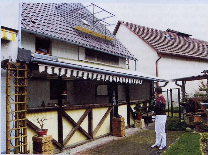
Teilansicht der massiven Zuchtanlage mit den Innenschlägen

Ralf Schmid sieht die Qualitätssteigerung durch eine Massenvermehrung dennoch nicht begründet. Zweitklassige Tiere verbleiben nicht in seinem Bestand. Im Hinblick auf das quantitativ angestrebte Leistungsvermögen, basiert die Zuchtarbeit qualitativ auf höchstem Niveau. Im Vordergrund steht die Vitalität seiner Zuchtstämme, wie das Mitglied des Zuchtbu-