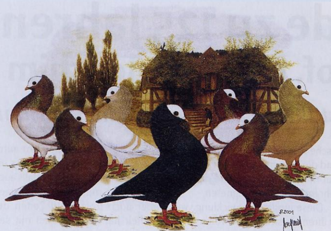
Anmutig wirkende Mookeetauben – gemalt von Ralf Schmid

Mit dem Betreiben der Rassetaubenzucht gilt Ralf Schmid's weitreichendes Interesse der Versorgung, speziell der Fütterung. Stelle er zunächst für den Bedarf seiner Zuchttiere die Mischungen zusammen, folgten in Anbetracht seiner züchterischen Fortschritte sehr bald einige Züchter den Empfehlungen des Erfahrenen. Ein be-