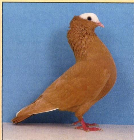
1,0 Mookee gelb, hv96 SVEB; W. Hellmich, Osnabrück.

etwas kürzer sein. Ralf Schmid stellte in beiden Geschlechtern die vorzüglichen Tauben: Der Täuber mit v97 SB zeigte, wo es in der Zucht lang gehen muss, aber auch die Täubin mit v97 LVE hatte wirklich alles und zeigte als Täubin noch etwas mehr die beeindruckende Eleganz des Idealtyps. Mit dieser Leistung und weiteren zwei Hv-Tauben in beiden Geschlechtern sicherte er sich den ersten Platz im Siegerring-Wettbewerb.