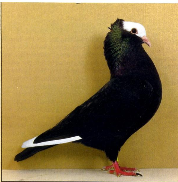
1,0 Mooketaube schwarz, v97 SB; R. Schmid, Langenbrettach