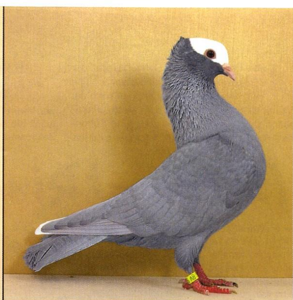
0,1 Mooketaube silber, v97 SB; F. Bierbaum, Bremen