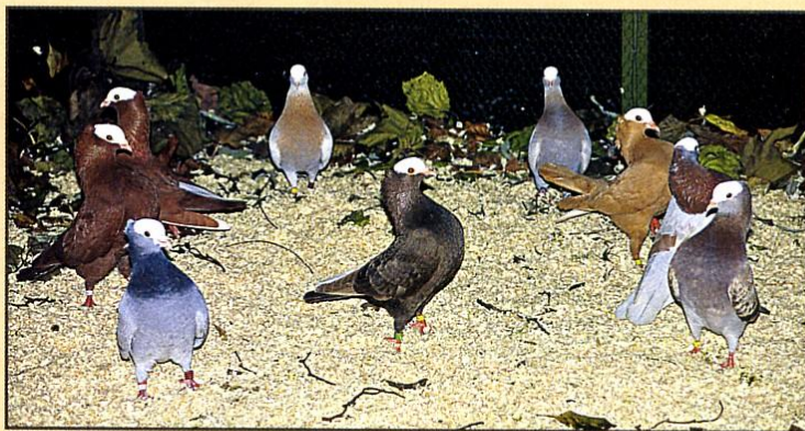
Mookeetauben in vielen Farbschlägen in der Schauvoliere.

angenehme, auch zutrauliche Taube ist (wie man in der Großvoliere beobachten konnte) und sich die Tauben in der typischen Körperhaltung gut stellten.